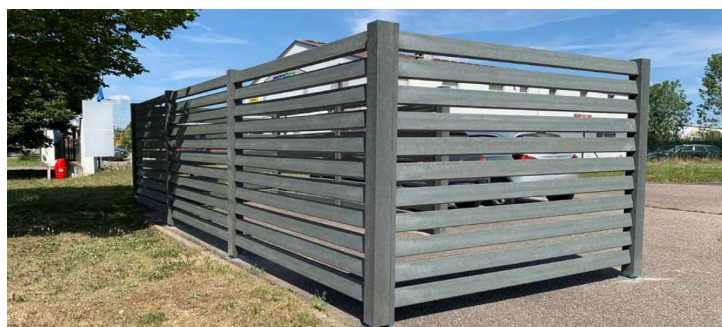
Photo non contractuelle : 8 lames et non 11 comme présenté ci-dessus

Nous consulter Le cout de transport dépend des quantités et du département de livraison.