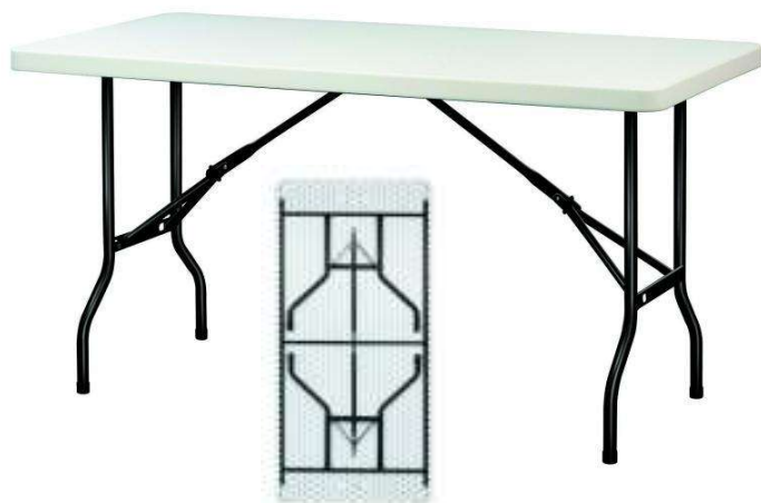
Table pliante Regina